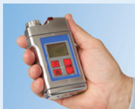
H 2 O 2 Handmessgerät