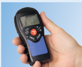
handliches Laser-Entfernungsmessgerät zur Ermittlung der Raumgröße