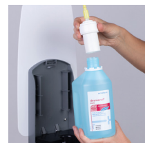
Pumpaufsatz auf neue Flasche aufsetzen*