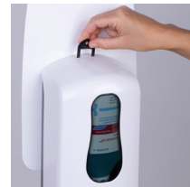
Spender mit Schlüssel entsperren