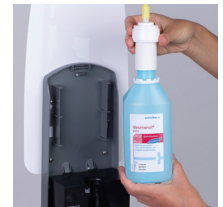
Leere Flasche entnehmen und Pumpaufsatz abschrauben