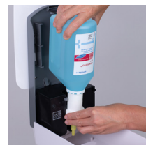
Neue Flasche in den Spender einsetzen