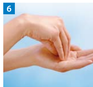
Schritt 6 Kreisendes Reiben hin und her mit geschlossenen Fingern der rechten Hand in der linken Handfläche und umgekehrt.