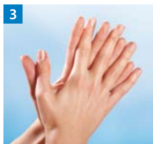
Schritt 3 Handfläche auf Handfläche mit verschränkten, gespreizten Fingern.