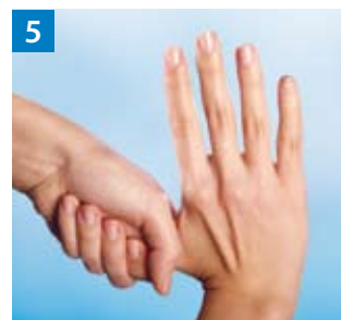
Schritt 5 Kreisendes Reiben des rechten Daumens in der geschlossenen linken Handfläche und umgekehrt.