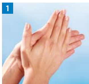
Schritt 1 Handfläche auf Handfläche.