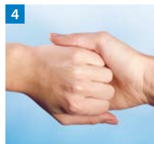
Schritt 4 Außenseite der Finger auf gegenüberliegende Handflächen mit verschränkten Fingern.