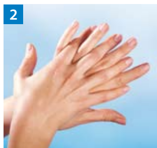
Schritt 2 Rechte Handfläche über linkem Handrücken und linke Handfläche über rechtem Handrücken.